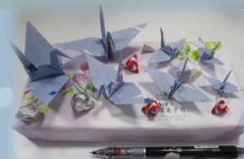
かわいらしい 折り鶴

(医)恵仁会ケアハウス 青葉の里 〒930-0221 富山県中新川郡立山町前沢1181 TEL 076-463-2155 FAX 076-463-2166 E-mail: aobanosato@cap.ocn.ne.jp HP http://www.kejinkai-f.or.jp <受付時間>9:00~17:00